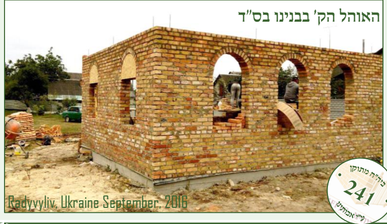
Radyvyliv, Ukraine September, 2016

מנוחת קדשו של הרב הקדוש בשיר ושבח להשי"ת ווערט געמאכט געוואלדיגע פארשריט בבנין האוהל הק' של רבינו הק' רבי יצחק זי"ע - בנדבת ידיד אבותינו ידיד כל בית ישראל בונה עולמות של תורה הגה"צ אבדק"ק בראד שליט"א