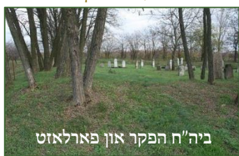
ביה"ח הפקר און פארלאזט